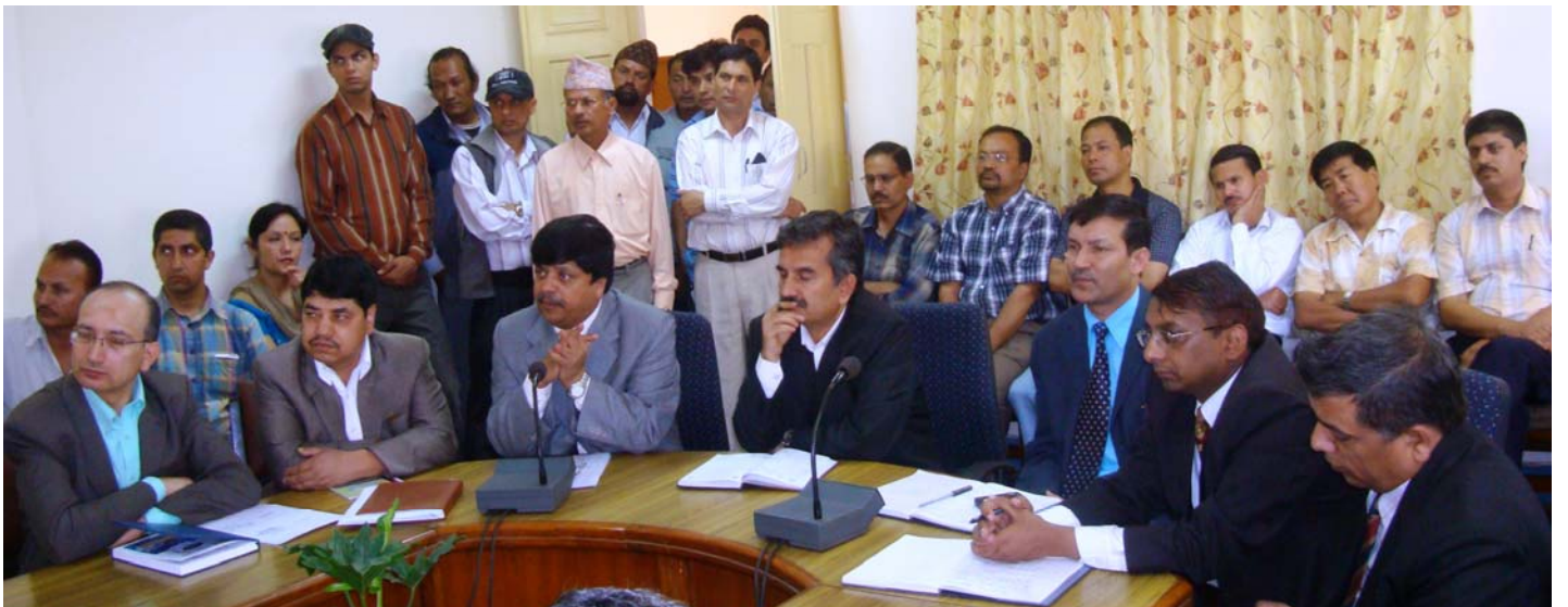
भन्सार विभागको ब्रिफिङ अभिरुचिपूर्वक ग्रहण गर्दै अर्थमन्त्री तथा अन्य पदाधिकारीहरू

कार्यक्रममा निर्देशन दिने क्रममा अर्थमन्त्री पाण्डेले तराईको कमजोर शान्तिसुरक्षाको अवस्थाको कारण भन्सार प्रशासनको सुरक्षामा देखापरेको संकटमा सरकारको ध्यान जाने आश्वासन दिनु भयो। भन्सार प्रशासनको आफ्नै सुरक्षा क्षमता तथा एकद्वार सुरक्षा प्रणालीको विकास नभए सम्म हालको सशस्त्र प्रहरी नै भन्सार प्रशासनको मातहतमा रहने व्यवस्थाको सम्भावनामा छलफल गरिने तथा भन्सार प्रशासनको आवश्यक थप पूर्वाधार व्यवस्थामा ध्यान दिइने आश्वासन दिनु भयो। सदाचार पद्धतिमा भएको सुधार राम्रो कुरा हो भन्दै सुविधा बृद्धिलाई सदाचारको एकमात्र आधार बनाइएको हुँदा नैतिकता तथा सामाजिक डरलाई पनि सदाचार पद्धतिको आधार बनाउनु पर्ने सुझाव दिनुभयो। उहाँले उठन सक्ने राजस्वको आधा अंश अझै पनि राजस्व प्रशासनको लक्ष्य भन्दा बाहिर रहेकोले भन्सार प्रशासन अझ गम्भीरतापूर्वक अगाडि वढनुपर्ने धारणा समेत राख्नु भयो।