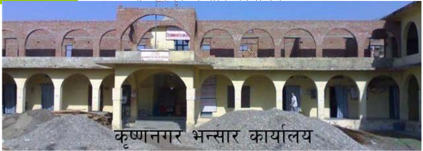
कृष्णनगर भन्सार कार्यालय